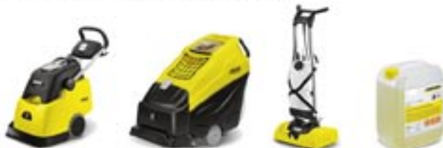
BRC 4545 C Ep BRC 5070 W Baterias BRS 43/500 C RM 768 iCapsol

La solución eficaz para la limpieza de moquetas consiste en la aplicación del sistema iCapsol con una máquina de las series BRC o BRS.